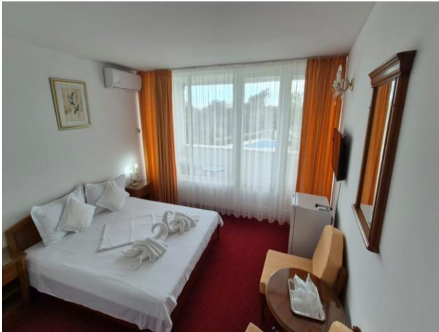
Cameră dublă cu vedere