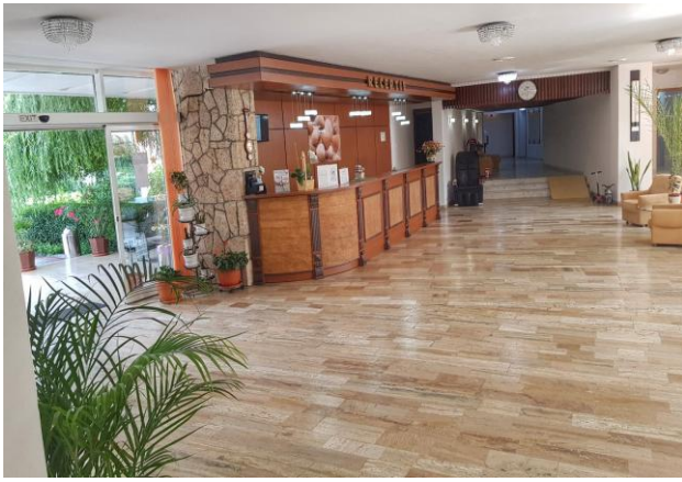
Recepție și lobby