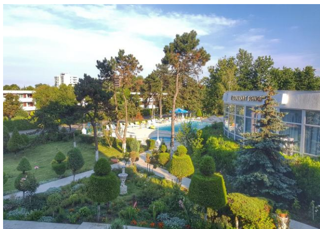
Grădină și piscină

Imagini orientative: exterior, piscină, camere și recepție