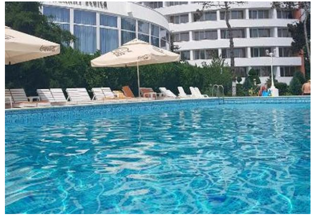
Piscină și hotel