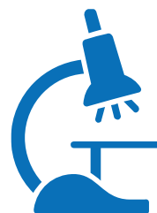
Servicii de laborator