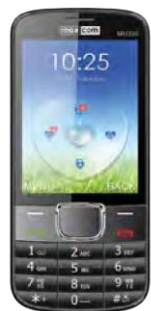
MaxCom 320 0 EUR