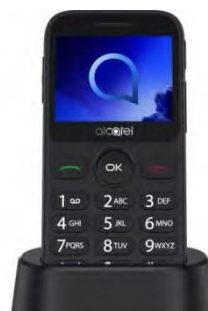
Alcatel 2019 Senior 0 EUR

Telefoane in limita stocului. Traficul internet ce poate fi consumat in roaming SEE se calculeaza dupa formula reglementata=UE.