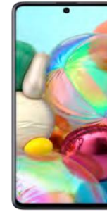
Samsung A71 0 EUR