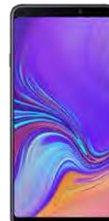
Samsung A71 0 EUR