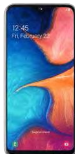
Samsung A20e 14.3 EUR