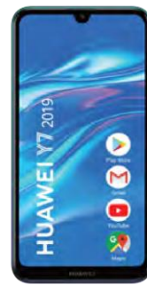
Huawei Y7 2019 4.22 EUR