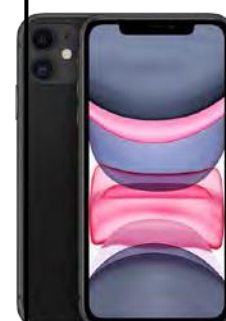
iPhone 11 128 GB 0 EUR