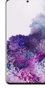
Samsung S20 128 GB 0 EUR