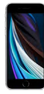
iPhone SE 128 GB 0 EUR