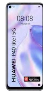
Huawei P40 lite 5G 0 EUR