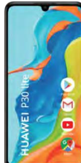
Huawei P30 LITE 0 EUR